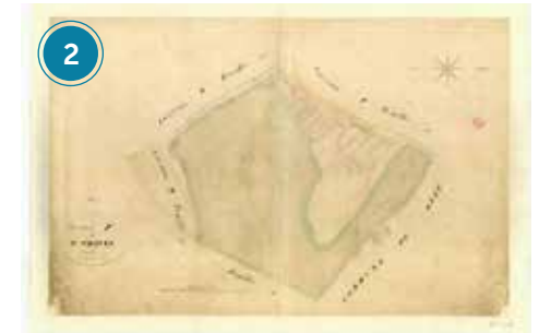
La cité-jardin du Verger

À l'origine du peuplement du territoire de Notre-Dame-de-Toutes-Aides, une chapelle dont la construction remonterait au 12 e siècle, et dont l'histoire raconte qu'elle aurait été commanditée par la duchesse Constance II de Bretagne, suite au dénouement heureux de l'enlèvement de son fils, le duc Arthur I er . L'édifice est reconstruit au 17 e siècle. L'église actuelle est élevée à côté de la chapelle à partir de 1878 sous la direction de l'architecte François Bougoüin. Elle est ouverte au culte en 1881. La tour clocher est érigée de 1893 à 1895 devant l'ancienne chapelle, depuis intégrée à l'intérieur de l'église (chapelle de la Vierge). Endommagée par les bombardements de 1944, l'église fait l'objet de travaux de réparations.