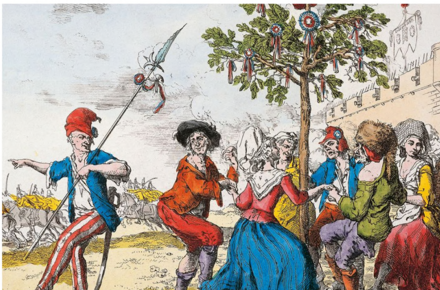
Gravure du XVIIIe siècle représentant une danse de la Carmagnole autour d'un arbre de la Liberté