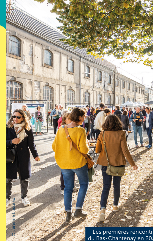
Les premières rencontres du Bas-Chantenay en 2022