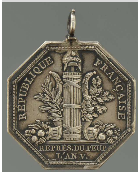
Médaille du Conseil des Cinq-Cents.

53 – Médiathèque de Nantes, Cotes 50240, 48048C, 61404.