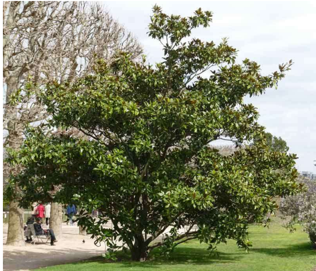
Magnolia à grandes fleurs.