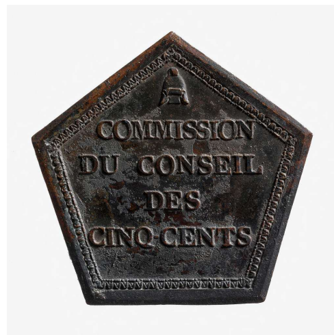
Médaille de fonction de la commission du Conseil des Cinq-cents, Musée Carnavalet - Histoire de Paris .

De nouvelles tensions entre l'aile droite et l'aile gauche de cette Assemblée législative émergent rapidement. Pierre Grelier va devoir trouver sa place dans cette bataille politique des extrêmes qui tend à remettre en cause par les uns, les acquis républicains et par les autres, la démocratie récemment bafouée par les amis de feu Robespierre. D'où l'épisode du 17 mai 1797, qui aurait pu, s'il avait eu lieu, conduire à l'épuration des députés siégeant à la droite dans les deux chambres du Directoire. Sur des bruits d'un possible complot, Grelier prend en charge la protection de ces derniers, bien que ceux-ci ne fassent pas partie de son clan.