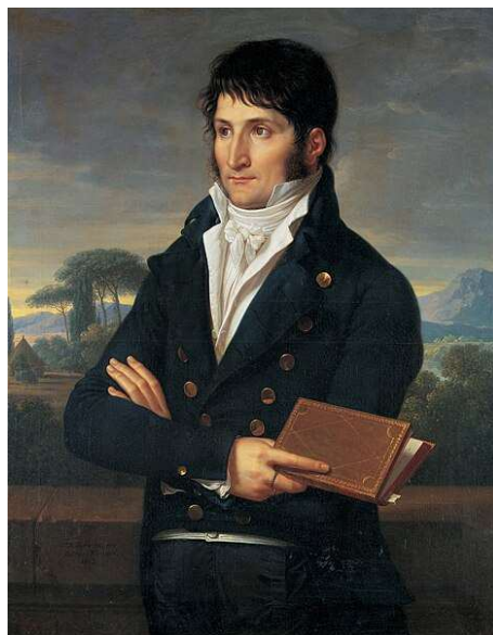
Portrait de Lucien Bonaparte, par François-Xavier Fabre, Musée napoléonien de Rome.