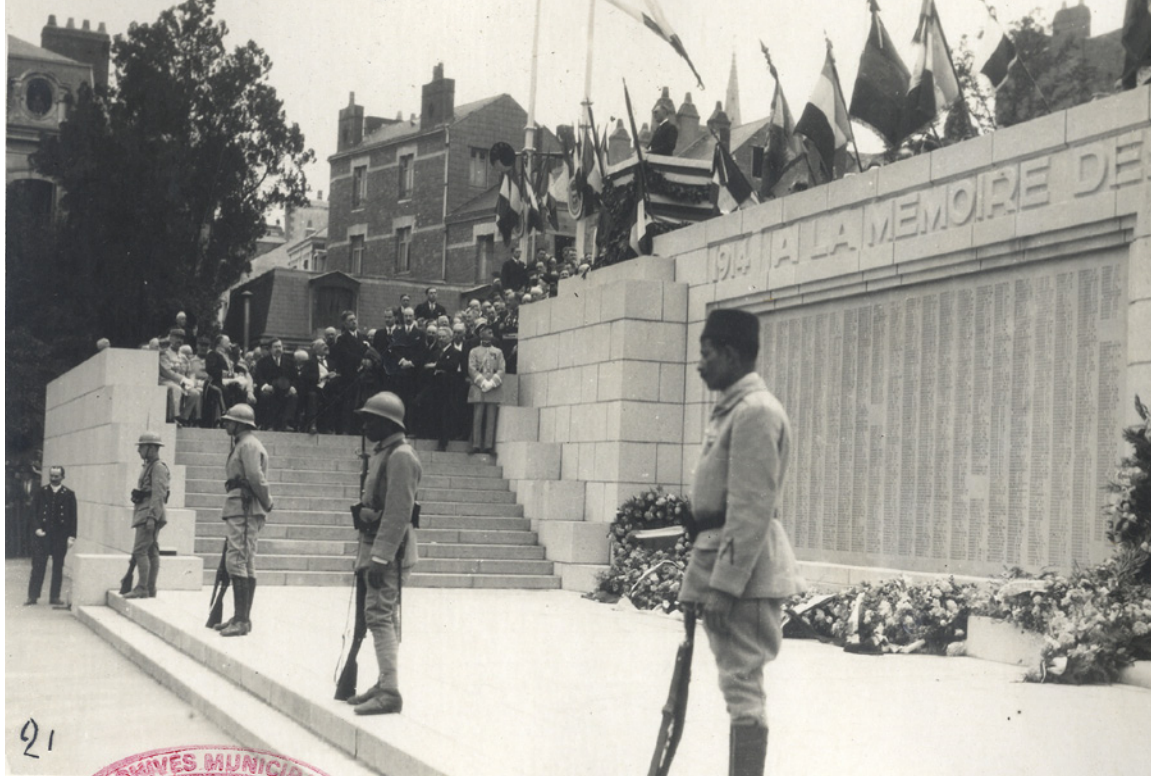
L'inauguration du monument

Le monument aux morts est inauguré le 17 juillet 1927, lors du Congrès national de l'Union Nationale des Mutilés et Réformés qui se tient à Nantes pour sa 3 e édition. Le ministre de la guerre Paul Painlevé est présent aux côtés du préfet de la Loire-Inférieure Paul Mathivet et du général-commandant de XI e corps d'armée Camille Ragueneau. Les discours prononcés du haut des marches du monument sont précédés des défilés sur les cours Saint-Pierre et Saint-André des sociétés patriotiques d'anciens combattants et de l'ensemble des corps d'armée, avec parmi eux les sections des soldats étrangers. Les Nantais se déplacent en nombre pour assister à cet hommage et chercher, gravés sur les tables les noms de leurs époux, frères ou fils morts aux combats.