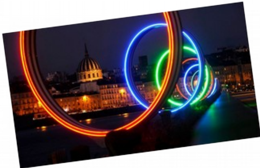
« Paysage glissé » œuvre temporaire installée sur les remparts du Château des ducs de Bretagne, les Anneaux de Daniel Buren et Patrick Bouchain sur le quai des Antilles, le jardin des Fonderies sur l'Île de Nantes